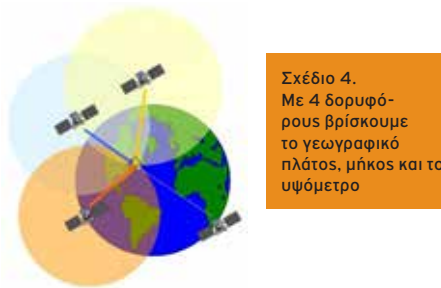
Σχέδιο 4. Με 4 δορυφόρους βρίσκουμε το γεωγραφικό πλάτος, μήκος και το υψόμετρο

Και ας έρθουμε τώρα στην πολύ πιο δύσκολη μέτρηση του χρόνου \Delta t . Το φως διανύει ένα μέτρο σε τρία nanoseconds (ns), δηλαδή ένα χιλιοστό του χιλιοστού του χιλιοστού του δευτερολέπτου, 0,000000001 δευτερόλεπτα. Από τον δορυφόρο μέχρι το σκάφος μας θα κάνει 0,067 δευτερόλεπτα (67 ms 67 milliseconds), και μέχρι να έρθει, εμείς θα έχουμε κουνηθεί 0,17 χιλιοστά (mm millimeters)!!! Εάν κάνουμε ένα λάθος ενός