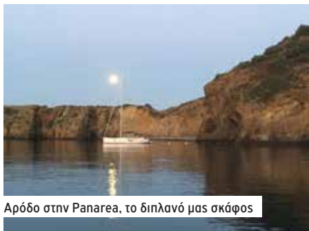
Όρμος στην Panarea, το διπλανό μας σκάφος

Ωρα να πάρουμε τον δρόμο της επιστροφής, σιγά σιγά όμως. Μόνο δώδεκα μίλια νοτιοδυτικά είναι η Panarea . Νησί πανέμορφο! Δυσκολευόμαστε να βρούμε ένα όρμο ελεύθερο να φουντάρουμε! Παντού ρεμέτζα, και αν πιάσεις κάποιον δεν θα περάσουν πέντε λεπτά πριν εμφανιστεί ο εισπράκτορας, 70 ευρώ πάλι τη νύχτα, με απόδειξη και δέχεται και κάρτες! Η μόνη υπηρεσία που προσφέρει είναι να μας βγάλει έξω και να μας ξαναφέρει με το δικό