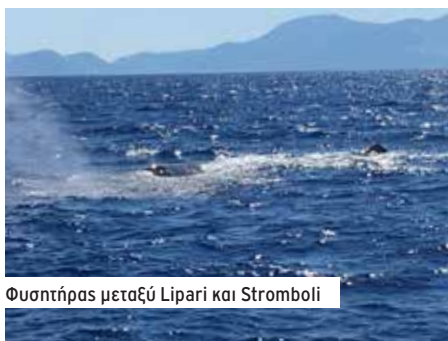
Φουσητήρας μεταξύ Lipari και Stromboli