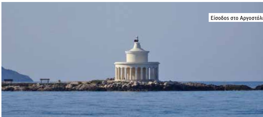
Είσοδος στο Αργοστόλι

του λιμανιού, βιράρουμε το μπαλόκι μας. Θα το μαινάρουμε μετά από τριάντα πέντε ώρες και 190 μίλια, την Τρίτη 21 Ιουνίου στην είσοδο του λιμανιού στο Αργοστόλι .