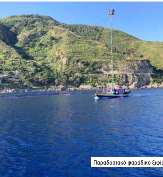
Παραδοσιακό ψαράδικο ξιφία

Έτοιμοι να γυρίσουμε Ελλάδα. Η Κεφαλονιά είναι μπροστά μας 180-200 μίλια. Το κύμα και ο λίγος αέρας φάτσα θα μας επιτρέψουν να γνωρίσουμε και το τελευταίο Ιταλικό λιμάνι στον δρόμο μας, λίγο βόρεια από το Capo Spartavento , Roccella Ionica, λιμάνι του Οδυσσέα το διαφημίζουν.