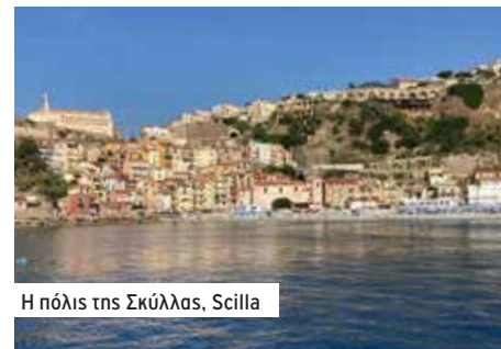
Η πόλις της Σκύλλας, Scilla

Εμείς, περάσαμε τη Σκύλλα και τη Χάρυβδη με ένα ωραίο αεράκι 20-25 κόμβους δευτερόπυρμα, και με το ρεύμα, 5-6 κόμβοι από τον βορρά στον νοτιά, ότι χρειαζόμασταν! Η Σκύλλα μάλλον δεν μας είδε και φτάσαμε και οι τέσσερις σώοι και αβλαβείς στο νοτιότερο ανατολικό άκρο της Ιταλίας, Capo Spartavento. Στον δρόμο συναντάμε τα παραδοσιακά ψαράδικα ξιφία. Ο καπετάνιος και ένα δύο άλλοι είναι σε δέκα δεκαπέντε μέτρα ύψος και σαρώνουν με τα μάτια τη θάλασσα. Ψάχνουν για ξιφίες που κοιμούνται ανέμελοι στην επιφάνεια του νερού. Όταν δουν κάποιον, τον πλησιάζουν και ένας ψαράς με καμάκι τρέχει πάνω στην τεράστια οριζόντια εξέδρα στην πλώρη να τον καμακώσει!!!