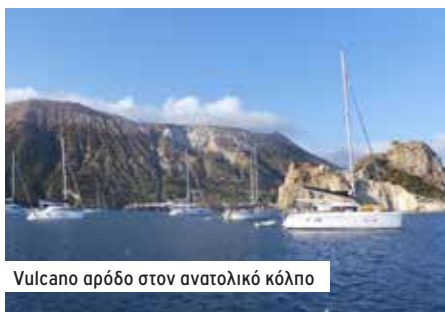
Vulcano αρόδο στον ανατολικό κόλπο

μύτη μας. Ο κόλπος είναι γεμάτος σκάφη, τα νερά πολύ βαθιά. Καταφέρνουμε να ριζούμε την άγκυρα μας κοντά στην παραλία. Ο αέρας έχει φορτώσει λίγο. Κοντά στις μια το βράδυ, και μετά από 95 μίλια όλα σχεδόν με μπαλόνι, πάμε για ύπνο. Τώρα ξημερώνει στο Vulcano, ανεγκέφαλοι δίπλα μας ακόμα πίνουν και τραγουδούν. Είναι έξι το πρωί!