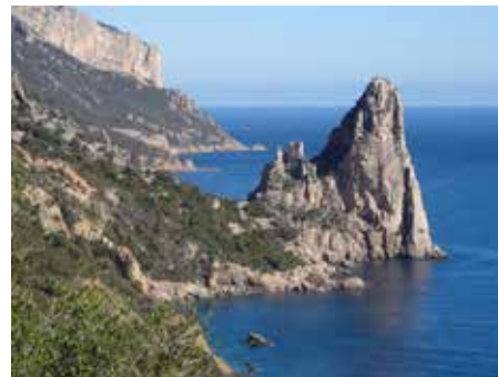
Λίγο βόρεια από τη Santa Maria di Navarese, Ανατολική Σαρδηνία