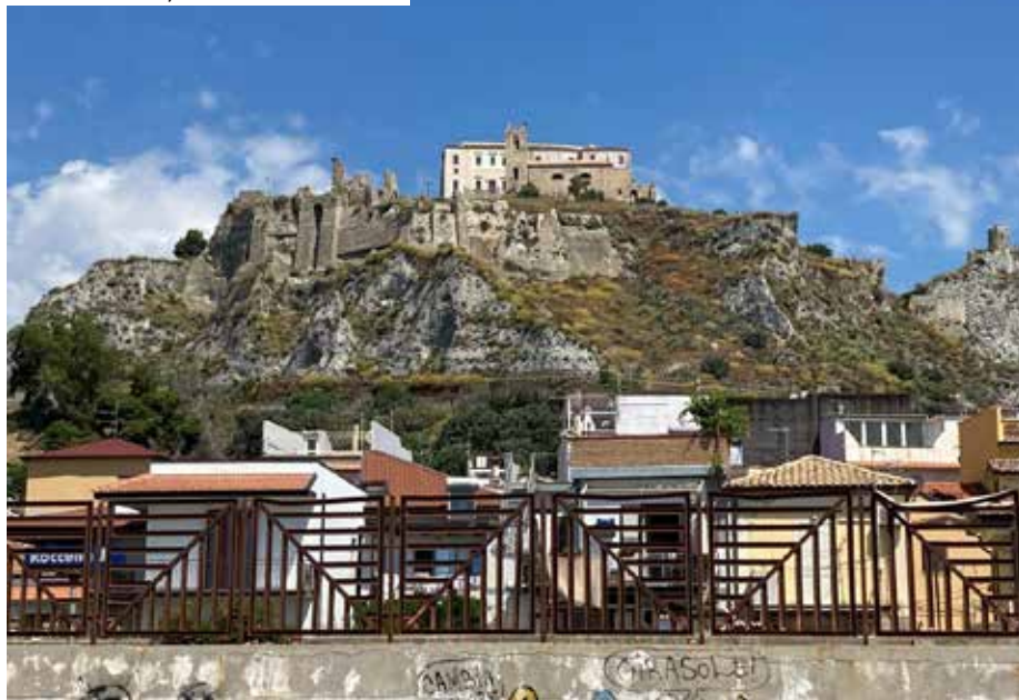
Roccella Ionica Λιμάνι του Οδυσσέα λένε

Εάν σας ενδιαφέρει το ταξίδι μας, θα βρείτε το ίχνος μας όπως το κατέγραψε το GPS της Αλκυονίδας, εδώ www.google.com/maps/d/u/O/edit?mid=1rdcrpum_COFaIB1JJi5QNE7YNMV3aC9M&usp=sharing ή το προηγούμενο ταξίδι με τη Μιμόζα www.google.com/maps/d/u/O/edit?mid=1gH538q5TgJPBBUnMTxcVO1cEYQ&usp=sharing Μπορείτε να κάνετε ζουμ στον χάρτη και να δείτε ακόμα και τις μανούβρες στα λιμάνια!!!