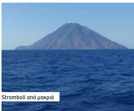
Stromboli από μακριά