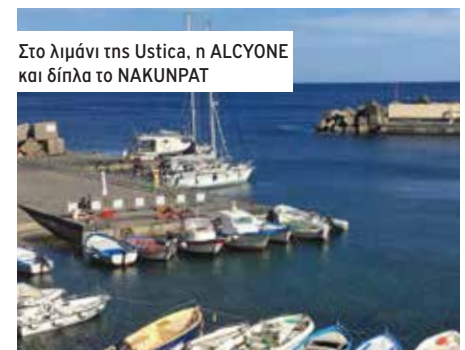
Στο λιμάνι της Ustica, η ALCYONE και δίπλα το NAKUNPAT

Τρίτη μέρα στο νησάκι Ustica . Περιμένουμε να πέσει ο άνεμος. Πρωί πρωί αναγκαστικά να βγούμε από τη θέση μας και να ξανά ρίξουμε άγκυρα. Με τον αέρα ξέσυρε η άγκυρα μας και είχαμε σχεδόν διπλώσει το σκάφος πάνω στον μόλο. Μανούβρα με πανιά, η ρεβέρσα αρνείται να πιάσει. Το λιμανάκι μικρό, μόνο 6 θέσεις για μας. Κυρίζουμε το νησί με τα πόδια. Το νησί έχει αρκετά μονοπάτια για πεζοπορία, η άλλη μας απασχόληση. Ταξιδεύοντας με ιστιοφόρο, περπατάμε πολύ! Αρκετή βλάστηση, σαν το Ιόνιο ή τις Σποράδες. Τα φραγκόσουκα έχουν γεμίσει όλο τον