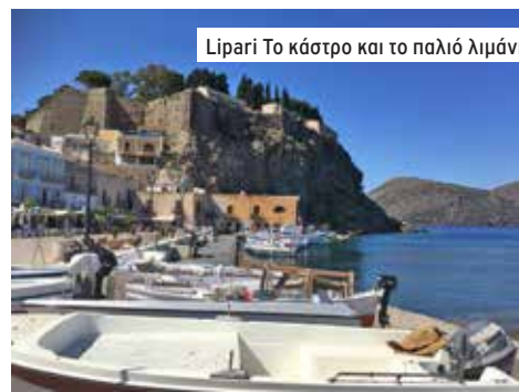
Lipari Το κάστρο και το παλιό λιμάνι

Δύο μέρες στο Lipari. Το πιο κατοικημένο νησί από τα επτά των Αιολίδων νήσων. Όλα ηφαιστεια. Βόλτα το απόγευμα στην πόλη αντι να πάμε για ύπνο! Σοκάκια, πεζοδρομοί, ένα κάστρο με ελληνικά ερείπια. Σήμερα είναι κάστρο, αλλά πριν ήταν Ακρόπολις! Η βόλτα στα σοκάκια είναι πολύ ευχάριστη, το παλιό λιμάνι κάτω από το κάστρο γραφικότατο. Και τα παγωτά τους πάντα εύγευστα. Δέσαμε το σκάφος σε μια πλωτή εξέδρα. Ιδιωτική, και υπάρχουν πέντε ή έξι γύρω γύρω. Όταν περάσει κανένα γρήγορο επιβατικό σκάφος, όχι μακριά, μας ταρακουνάει σε σημείο να μην μπορείς να κάτσεις όρθιος! Ούτε τουαλέτες ούτε ντους, μόνο ρεύμα και νερό. Πανάκριβα, 55€ η βραδιά, και είναι η χαμηλή σεζόν!