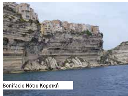
Bonifacio Νότια Κορσική

Olbia αποφασίζει η ρεβέρσα μας να μας μισό εγκαταλείψει! Πότε δουλεύει, πότε δεν δουλεύει. Μετά από ατελείωτα παζάρια με τους Ιταλούς που θέλουν να μείνουμε ένα μήνα εκεί, αποφασίζουμε να φύγουμε, έχουμε τα πανιά μας και θα δούμε με το καλό όταν φτάσουμε Φάληρο! Πλώρη νότια, θα μείνουμε μια νύχτα στη Santa Maria di Navarese . Ένα μικρό λιμανάκι, στα μέσα της ανατολικής Σαρδηνίας, που ξέρουμε καλά. Η Μιμόζα ξεχειμώνιασε για δέκα μήνες εκεί το 2015, και έχουμε ακόμα φίλους που μας περιμένουν! Λίγο βορειότερα ο κόλπος di Orosei, το πιο ωραίο μέρος της Σαρδηνίας, που εμείς επισκεφτήκαμε.