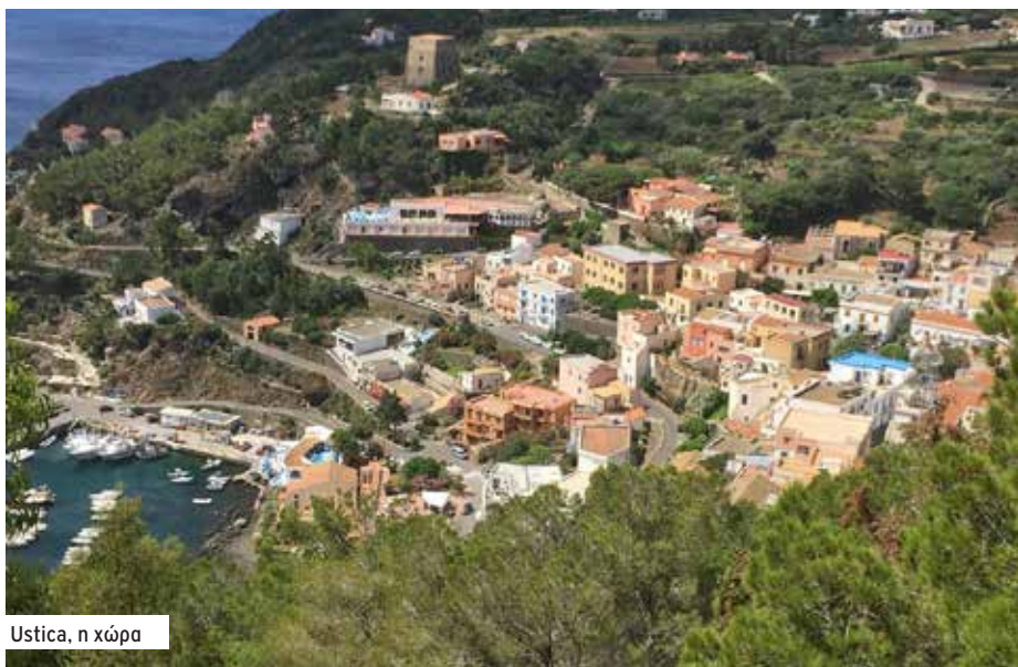
Ustica, η χώρα

τόπο! Ίσως μόνο μια δυο παραλίες προσβάσιμες, λάβα παντού. Τα πετρώματα είναι μαύρα, ηφαιστειογενή. Οι Ρωμαίοι ονομάζουν το νησί, Καμένη γη. Είμαστε πάνω στο ηφαιστειογενές τόξο. Αξίζει τον κόπο η επίσκεψη, λίγο μακριά από τους τουριστικούς προορισμούς, τουλάχιστον αρχές Ιουνίου.